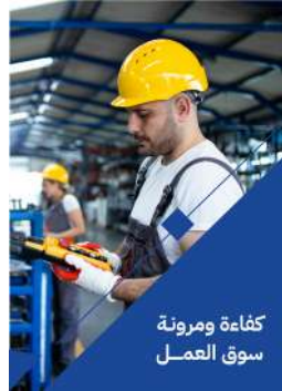
كفاءة ومرونة سوق العمل