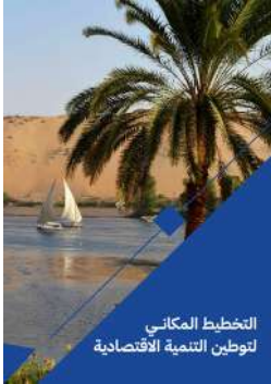
التخطيط المكاني لتوطين التنمية الاقتصادية