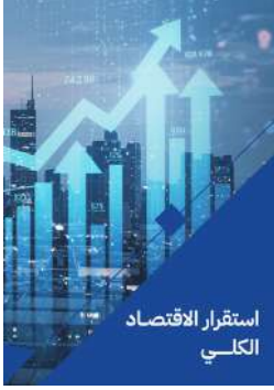
استقرار الاقتصاد الكلي