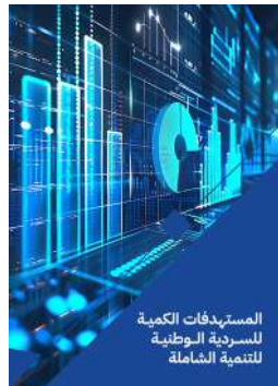
المستهدفات الكمية للسردية الوطنية للتنمية الشاملة