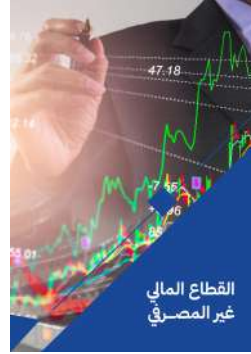
القطاع المالي غير المصرفي