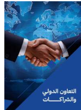
التعاون الدولي والشركات