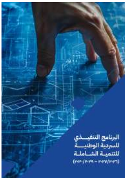
البرنامج التنفيذي للسردية الوطنية للتنمية الشاملة (2022-2030)