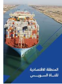
المنطقة الاقتصادية لقناة السويس