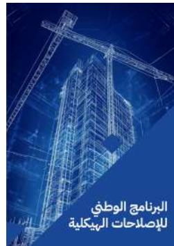
البرنامج الوطني للإصلاحات الهيكلية