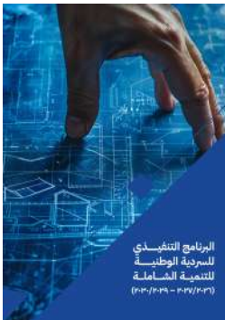
البرامج التنفيذية للسردية الوطنية للتنمية الشاملة (2022-2030)